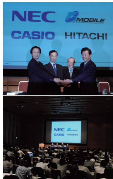
合同記者会見の様相

また、様々な事業領域での統合シナジーの実現、技術資産やノウハウ、リソースの一体化による開発力強化を図り、各社の商品ブランドを活かしながら、国内ならびに海外市場でより高い競争力を確立していきます。