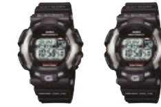
「G-SHOCK」GULFMAN GW-9100 / G-9100

メタルと樹脂のコンビジットデザインにより、上質感とカジュアル感を表現したレディースウォッチ。