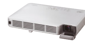
スーパースリムプロジェクター XJ-S46

インターネットへの直接接続機能を内蔵した、電子決済・店舗支援サービス対応の電子レジスター。