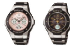
「G-ms」MSG-300 / MSG-3000

カシオ計算機は、財団法人日本産業デザイン振興会が主催する「2007年度グッドデザイン賞」(Gマーク)において、商品デザイン部門8点、コミュニケーションデザイン部門1点、合計9点を受賞しました。