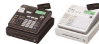
TE-2500 / TK-2500

ユニバーサルデザインを採用した、グリップタイプのレーザーキャナー一体型ハンドターミナル。