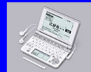
XD-SP4800 現在GfKでトップシェアモデル