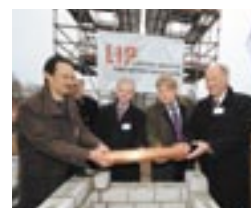
カシオヨーロッパ新社屋着工

ドイツに拠点を置く「カシオヨーロッパ」は、2009年の1月よりノーダシュテットの商業地区ノードポートに移転します。これまで分散していたオフィス・物流・サービス拠点を統合することで効率化を実現。