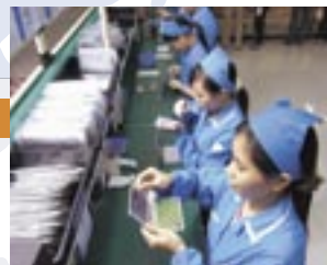
電子辞書生産ライン

欧州全体を統括する現地法人「カシオヨーロッパ」(ドイツ)のもと、イギリス、フランス、ノルウェー、スペイン、オランダの各国にグループ会社を置き、多様な欧州各国の文化に密着した活動を行っています。近年は、ヨーロッパ市場におけるデジタルカメラのシェアアップに取り組み、順調な成果をあげています。また、ロシアにも事務所を設置し、活動を進めています。