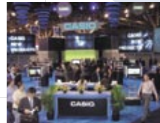
CES2008でのカシオのブース

米国には1970年に現地法人を設立し、広大な国土をカバーする販売網とサービス網の構築に努めてきました。現在は、販売会社「カシオアメリカ」「カシオカナダ」で北米エリアを担当しています。また、成長著しい南米向け地域に向けて積極的な展開を図るため、近年「カシオラテンアメリカ」「カシオメキシコ」を設立しました。