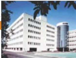
羽村技術センター