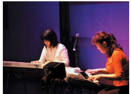
2006年11月 都内 科学技術館 サイエンスホールにて

カシオは電子楽器を通じて、豊かな音楽文化を生み出すことに貢献していきたいと考えています。