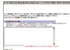
社内ホットライン

従業員は誰でも、イントラネットを通じて、直接的かつ不利益を被ることなく、本規範に関わる諸々の相談あるいは意見を発信することができます。