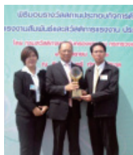
「労使関係・福利厚生における優良企業賞」授賞式の様子