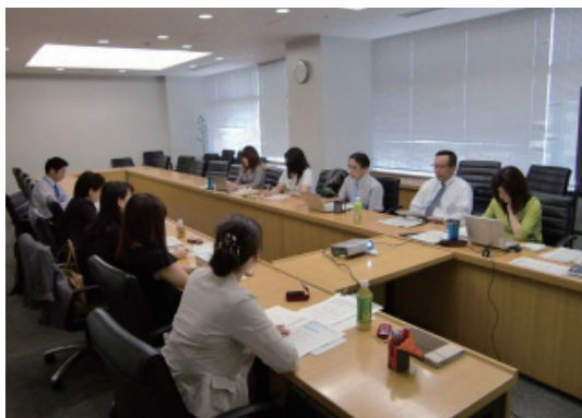
女性ワーキンググループ活動

今後は、女性社員のさらなる活躍促進、そして働き甲斐のある会社の実現に向けて、効果的で堅実な活動を実施していきます。