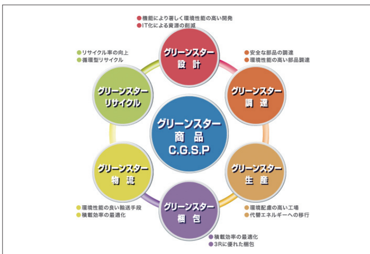
■カシオグリーンスターコンセプトイメージ図

グリーンスター商品の拡大に向けて、商品のライフサイクル各ステージごとの取り組みを強化し、全ステージで環境に与える影響を抑える「グリーンスターコンセプト」を掲げ、活動しています。