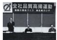
全社品質高揚運動