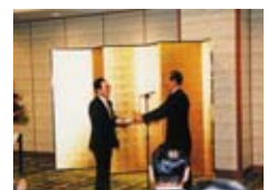
カシオ科学振興財団