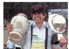
第1回カシオワールドオープン